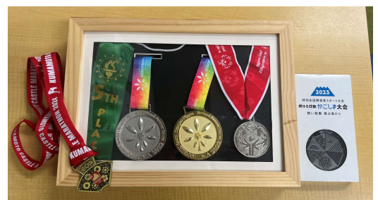
メダルコレクション

おばあちゃんにプレゼントを買ってあげます！ いつも可愛がってくれるおばあちゃんに感謝の気持ちを届けたいです。 父の日、母の日にも両親にプレゼントをしていきたいです。