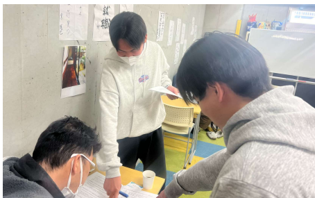
就労移行支援：ビジネス実務での場面 得意の「巻き込み力」を発揮！