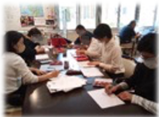
地域活動支援センター ピアサポートのと（穴水町）